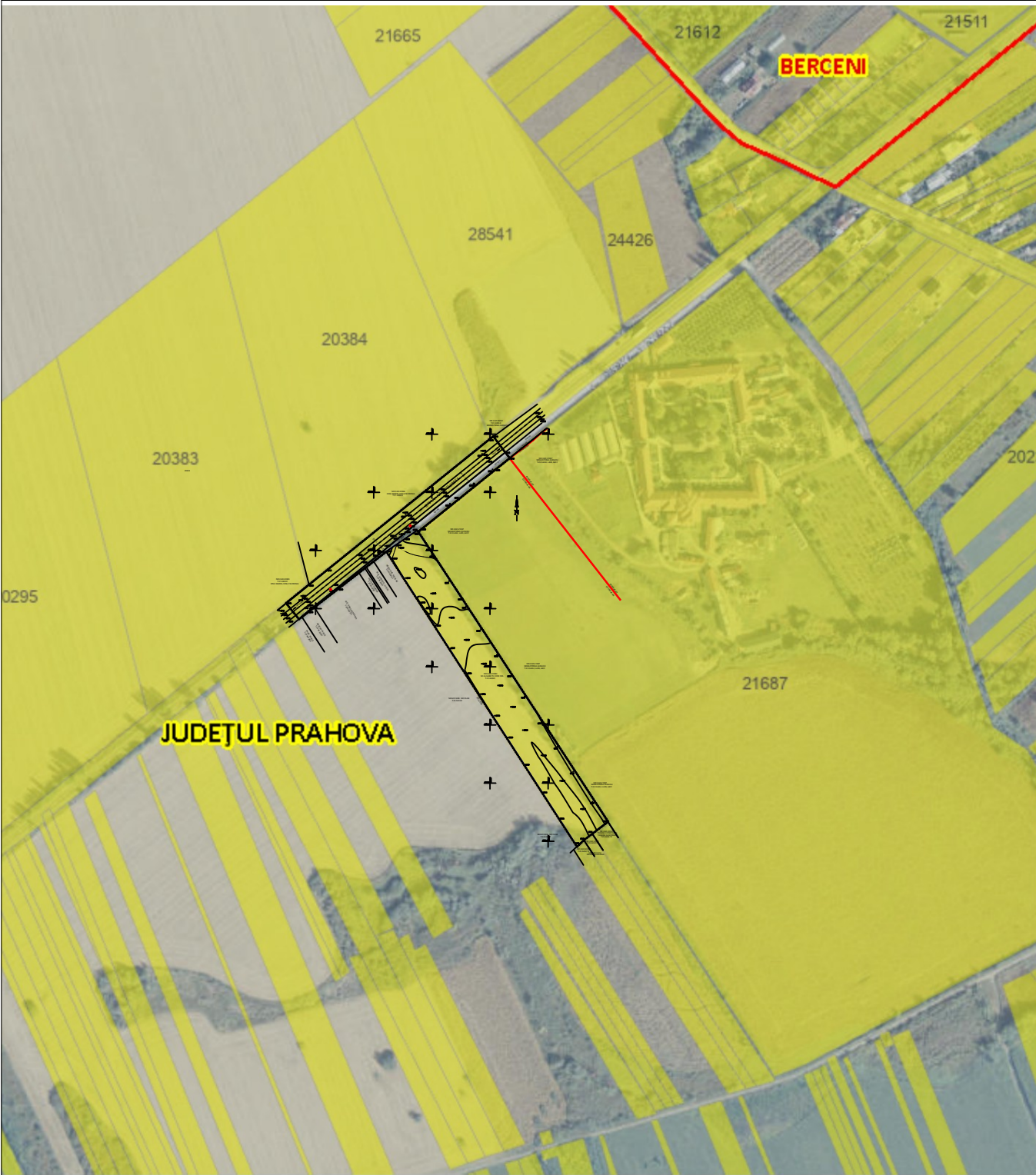
PLAN INCADRARE IN ETERRA sc 1:5000